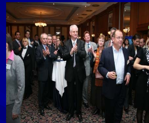
Ежегодное собрание АЕБ 2007

* действует на протяжении календарного года